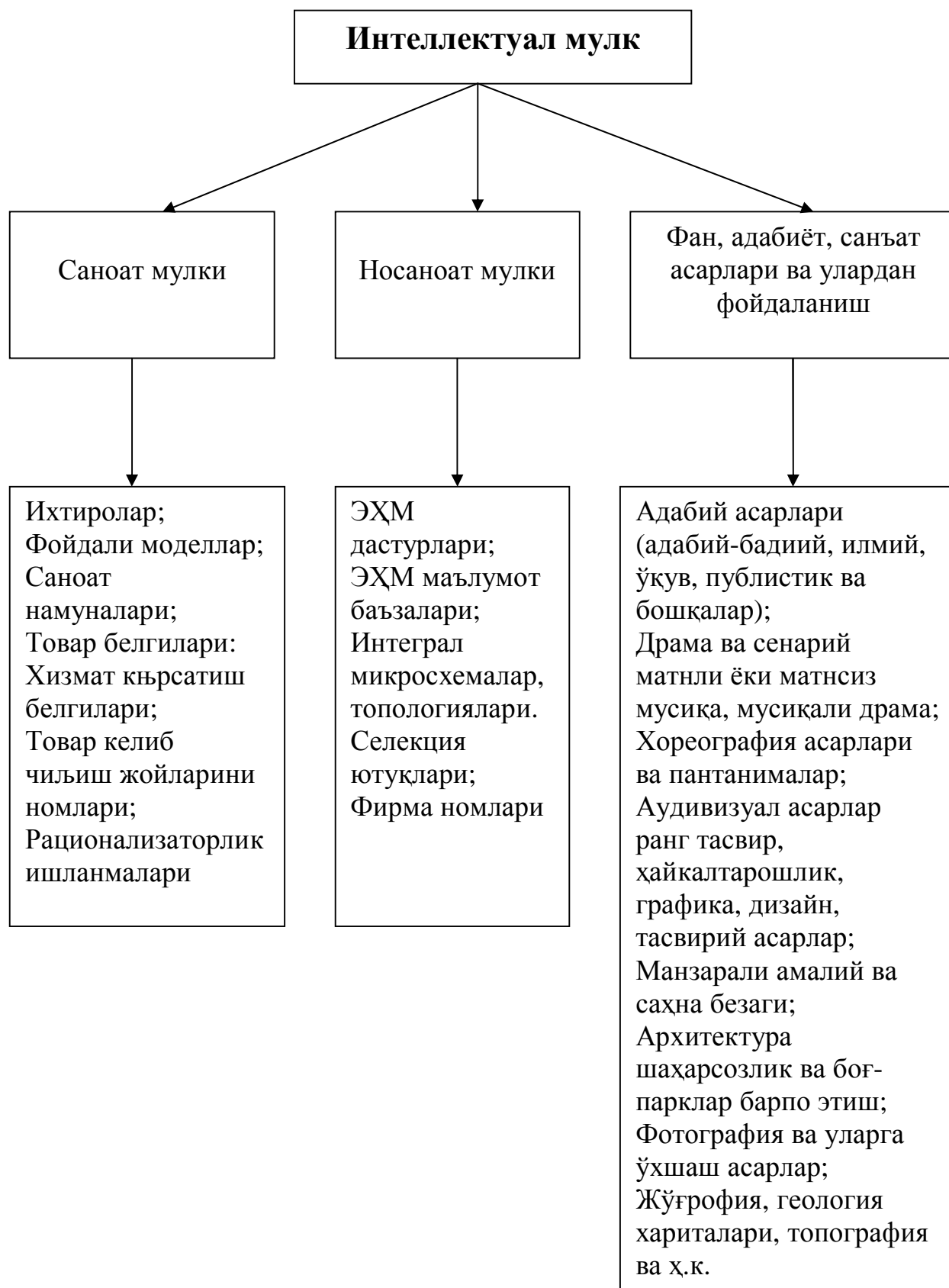
Расм 1.1. Интеллектуал мулк структуравий таркиби.