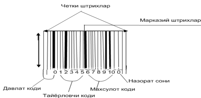
18.1-расм. 13 разрядли EAN коди.

Штрихли кодларнинг элементлари штрихлар ва ораликлар, кишилар ўқийдиган белгилар ва ёруғ зоналардан ташкил топган. Булардан штрихлар ва ораликлар маълумотларни кодлаш шаблонини белгилайди (аниқлайди). Инсон ўқийдиган белгилар бу - штрихлар ва ораликлар ёрдамида кодланган ахборотлар (маълумотлар)ни кишилар ўқиши учун матн сифатида берилишидир. Ёруғ зоналар эса штрихлар ва ораликларгача ва ундан кейинги тоза майдон бўлиб, бу зоналарнинг мавжудлиги штрихли кодни ўқиш учун энг зарур элементларидан бири бўлиб ҳисобланади (18.1-расм).