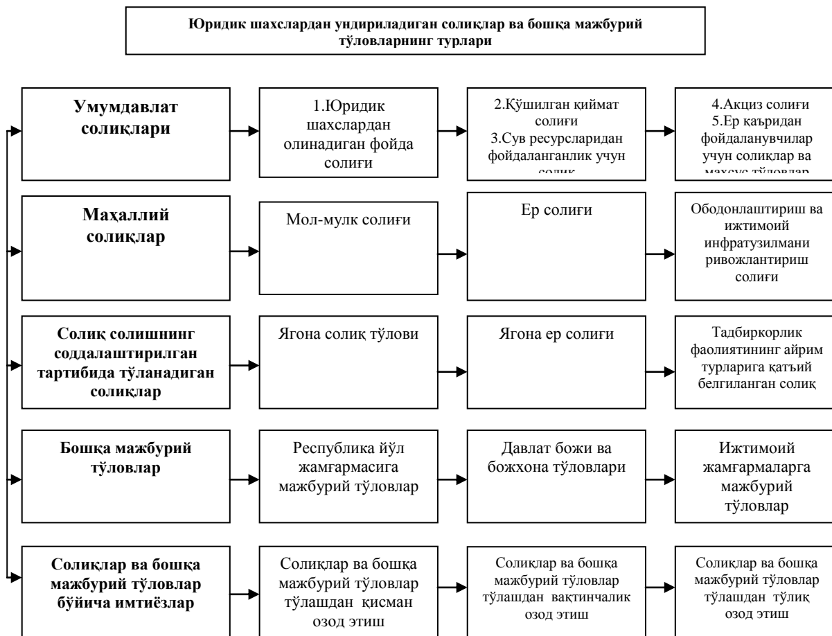
2.1.1-расм. Юридик шахслардан ундириладиган солиқлар ва бошқа мажбурий тўловларнинг турлари

Мамлакатимиз солиқ қонунчилигига мувофиқ солиқ тўловчилар икки катта гуруҳга, яъни юридик ва жисмоний шахслар гуруҳига бўлинади ва уларнинг фаолият кўрсатиш хусусиятидан келиб чиқиб яна таркибий қисмларга ажратиш мумкин. Республикамиз давлат бюджети даромадларини шакллантиришда юридик шахслар тўлайдиган солиқлар катта аҳамиятга эга.