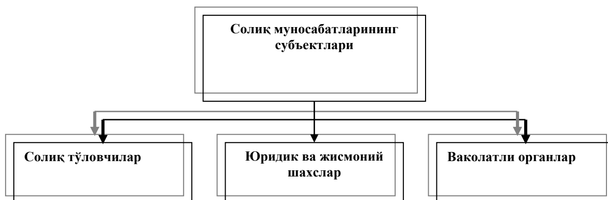
2.2.3-расм. Солиқ муносабатларининг субъектлари

Ўзбекистон Республикасининг резиденти деб Ўзбекистон Республикасида давлат рўйхатидан ўтган юридик шахс эътироф этилади.