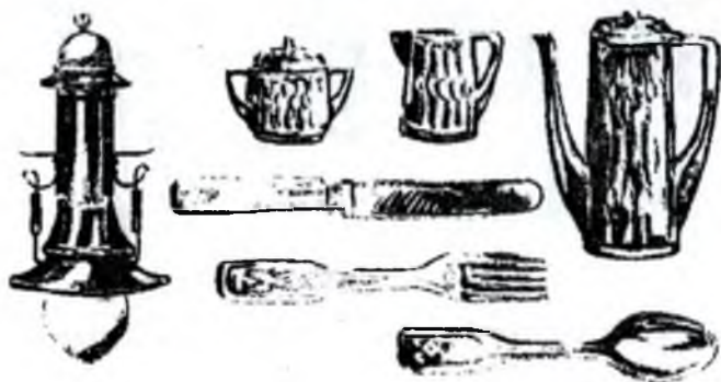
П.Беренс. Рўзгор буюмлари (Германия, XX аср бошлари)

а) бош учун таянч; б) курси; в) кесишган таянчлардаги ўриндик; г) фиръавн тахта