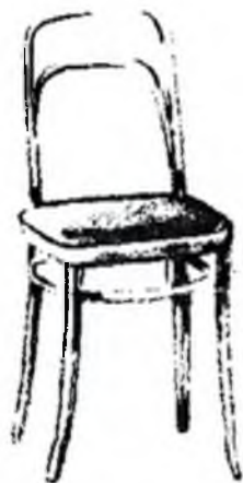
Тонет фирмасининг стуллари (XX аср бошлари)