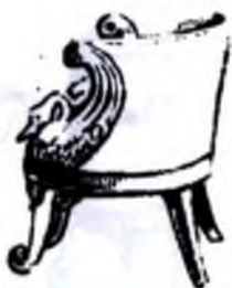
К.Росси Михайлов саройидаги мебель (Россия, XIX аср бошлари)