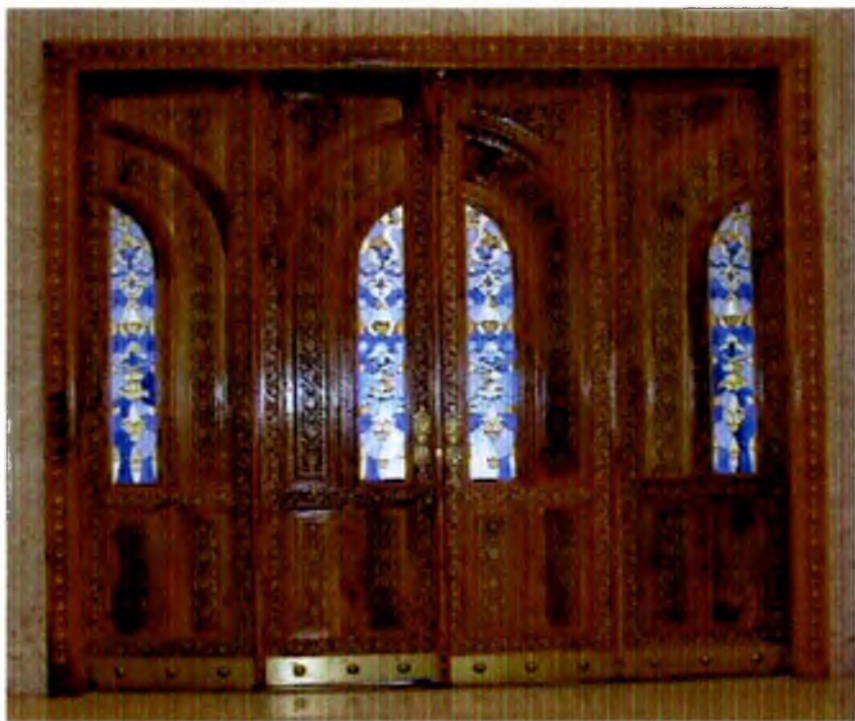
Ёғоч ўймакорлик санъати намунаси