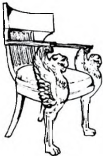
Амнир усулдаги ўриндиқ (кресло) IX асрнинг I-чорағи