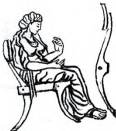
Стул (клисмос) (Қадимги Греция)