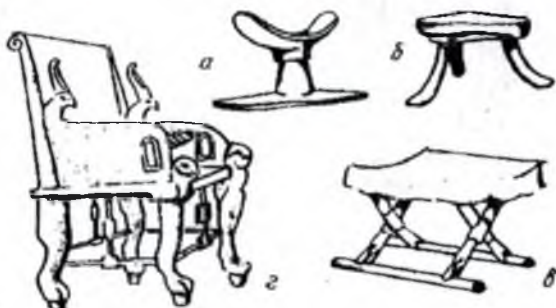
Мебель (Қадимги Миср)

а) бош учун таянч; б) курси; в) кесишган таянчлардаги ўриндик; г) фиръавн тахта