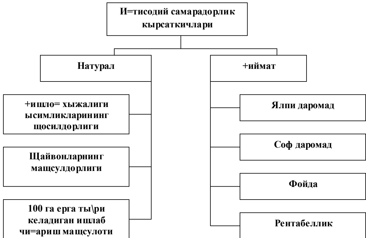
1-чизма. Ишлаб чиқаришнинг иқтисодий самарадорлиги кўрсаткичлари.

даражаси (Р) фойданинг маҳсулотнинг тўлиқ (тижорат) таннархига нисбатан %даги қиймати сифатида ҳисобланади. Бу кўрсаткичлар бутун қишлоқ хўжалигининг самарадорлигини характерлашда ҳам, тармоқ самарадорлигини ифодалашда алоҳида маҳсулот бўйича ҳам қўлланилади.