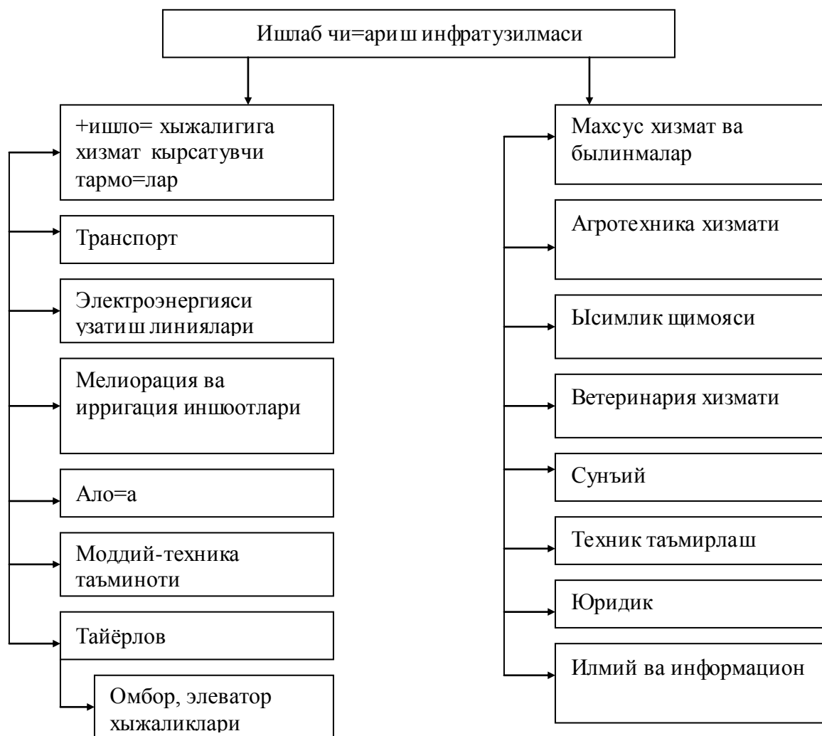
3-чизма. Ишлаб чиқариш инфратузилмасининг шаклланиши.

чиқариш жараёнини ривожлантирса, иккинчидан, аҳолининг озиқ-овқат ва бошқа маҳсулотларга бўлган талабини тўла қондириш имкони яратилади.