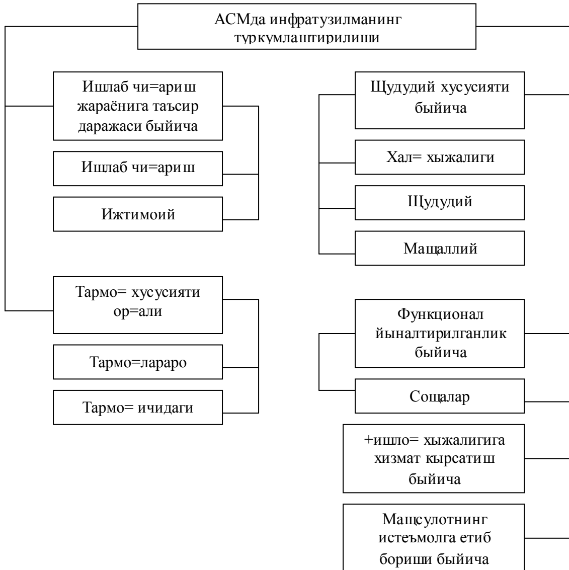
2-чизма. АСМ инфратузилмаси элементларининг туркумланиши.

M_{и} – ишлаб чиқариш инфратузилмасининг ишлаб чиқаришга кетган моддий харажатлари.