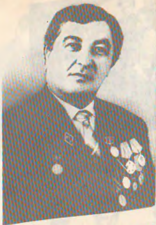
12-расм. Абдушариф Отажонов, та- ниқли композитор (1970 й.).