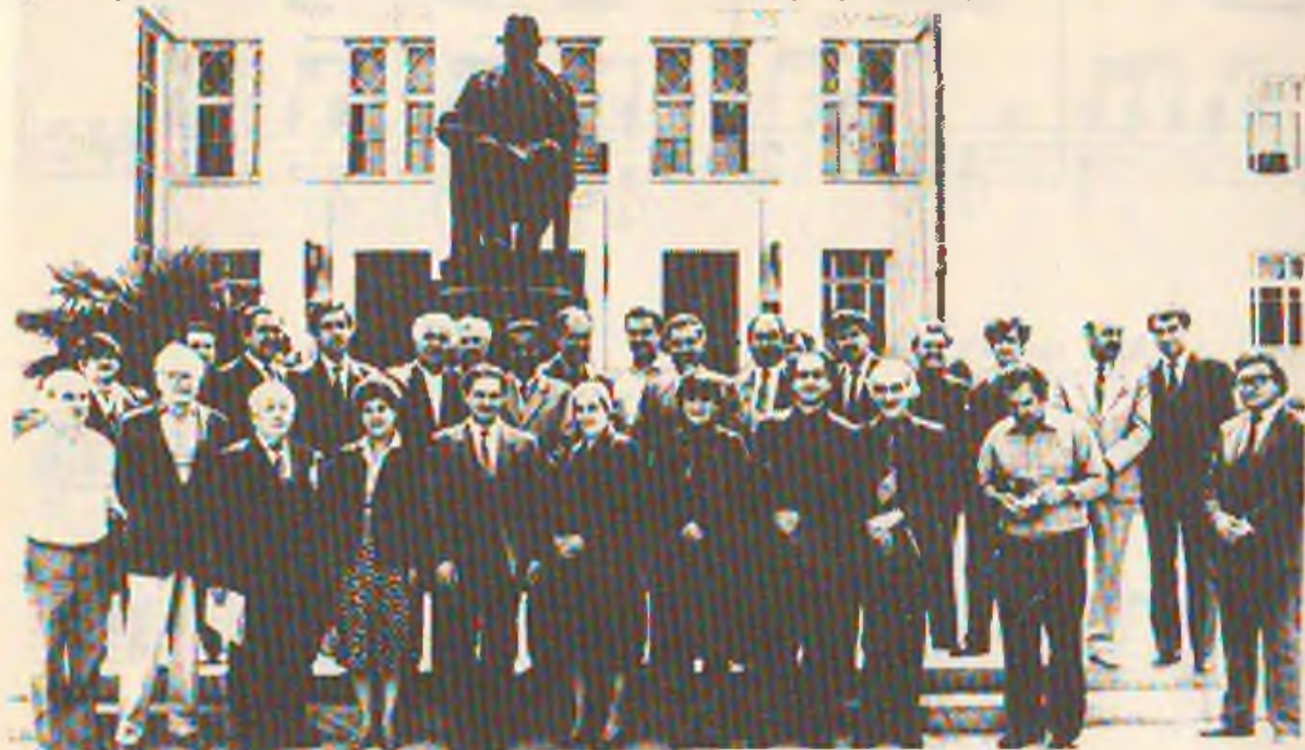
15 расм. Ҳазир Хожибеков номидаги Биринчи республикалараро халқ чолгулари ижрочилари танловининг ташкилий қўмитаси ва жюри хайъати аъзолари (Боку, 1986).