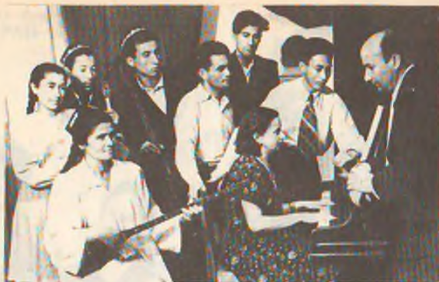
10-расм. Профессор А. И. Петросянц ўз талабалари билан (1950 й.).