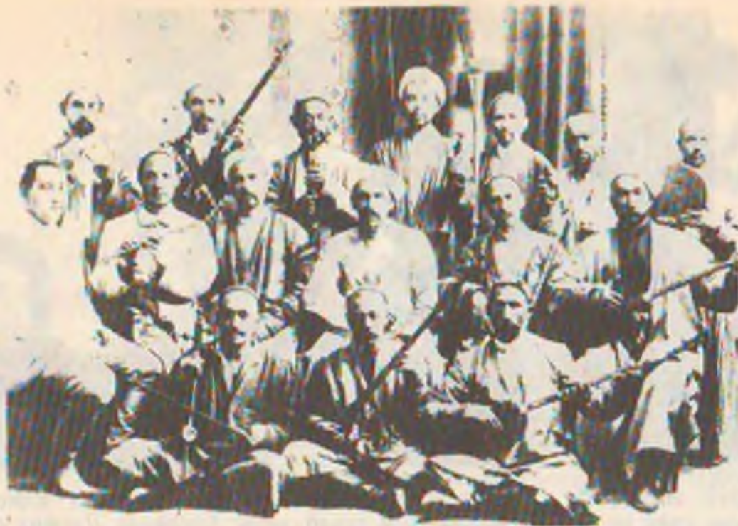
4-расм. 1923 йилда Москва шаҳрида бўлиб ўтган Биринчи Бутуниттифоқ қишлоқ хўжалик кўргазмаси концертларида қатнашган халқ чолғулари ижрочилари.