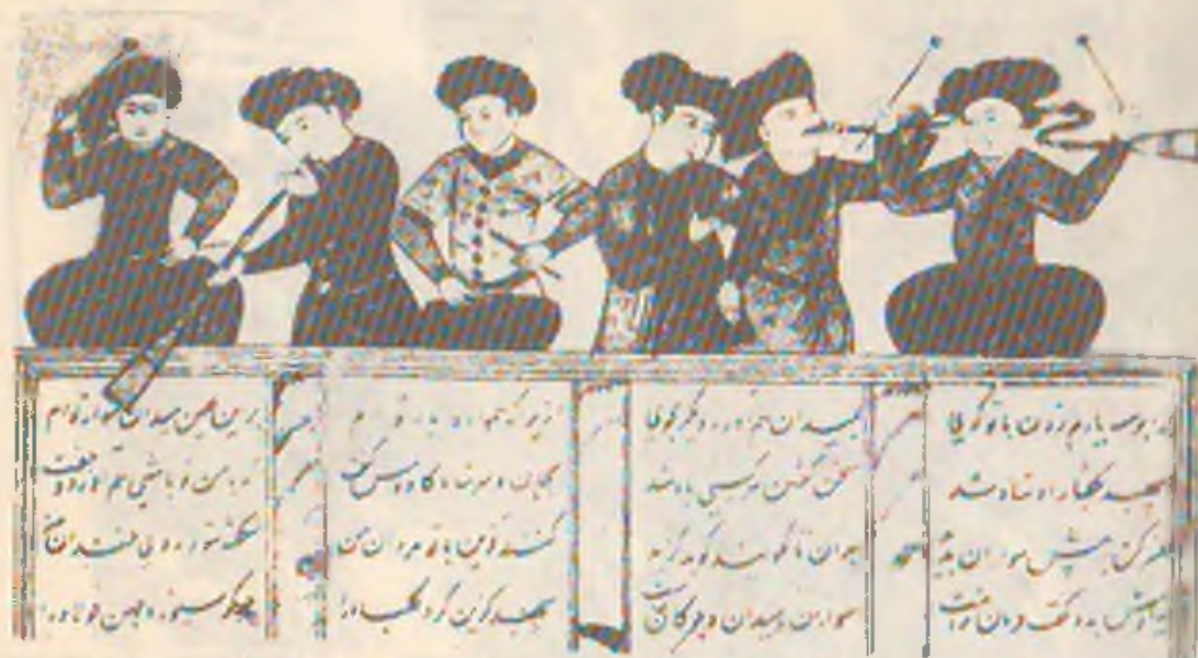
2-расм. XVII асрда китобга ишланган миниатюраларда тасвирланган ногора, карнай, сурнай чолғучилари (дамли ва урма зарбли чолғулар).