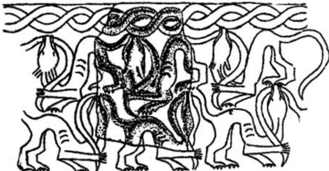
Рис. 2. Реконструкция узора керамического штампа. Нуртеппе. IV в. до н.э. – I в. н.э.

Во втором дахмаке могильника (III – VII вв.), расположенного близ селения Куркат (древний город Кирополь), сохранилась фигура лягушки из люстровой керамики, сидящей на подставке овальной формы. Очень выразительно переданы глаза, рот и конечности. Вздутия на спине лягушки показаны Поперечной и кривой штриховкой. Вдоль всего тела проходит сквозное отверстие, соответственно, эту фигурку использовали в качестве подвески-амулета [6, 295].