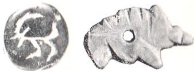
Рис. 4. Зооморфные каменные амулеты из Курката.

приподносить к губам. Левая рука опирается на бедро. Перед персонажем на землю поставлен большой сосуд, по форме напоминающий кувшин. Правая нога мужчины чуть оттянута назад, в соответствии с формой ограничивающей композицию оправы [3, рис. 76, 77].