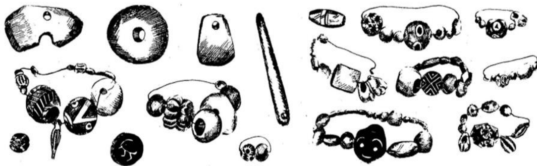
Рис. 3. Бусы и амулеты из Курката.

Искусство художественной обработки камня представлено бусами и амулетами, штампами и формами для литья украшений. В могильнике у сел. Куркат (древний Курушкада - Кирополь) III – VII вв., расположенном в Спитаменском районе, внутри двух дахм было обнаружено около 850 бусин и амулетов разных форм и размеров, цветов и декора, материала и способов изготовления. Они получены из речной гальки, полудрагоценных и драгоценных камней, стекла и пасты и морского жемчуга.