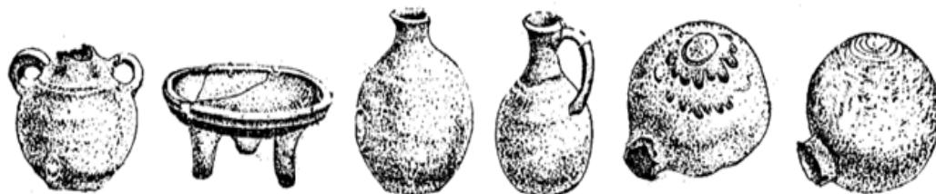
Рис. 1. Гончарные сосуды из Ходжаи Соф. I – III вв.

Заслуживает внимания блюдо глубиной 4 см и диаметром 32,5 см изготовлено на гончарном круге, снизу к нему вручную прилеплены три ножки высотой 5,5 см. Снаружи блюдо покрашено светло-розовым ангобом. На венчике сосуда имеется желобок, вероятно, предназначенный для крышки.