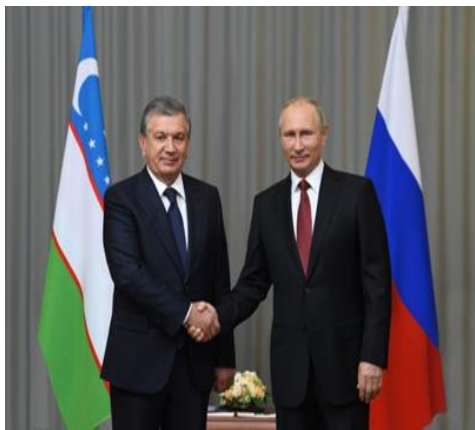
Ўзбекистон – Россия