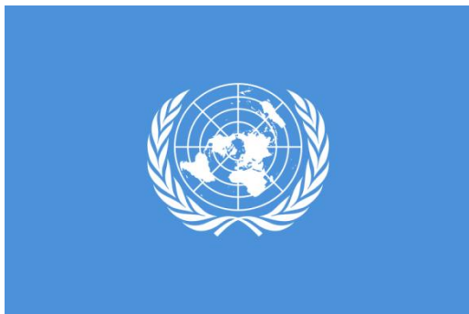
O'zbekiston – BMT