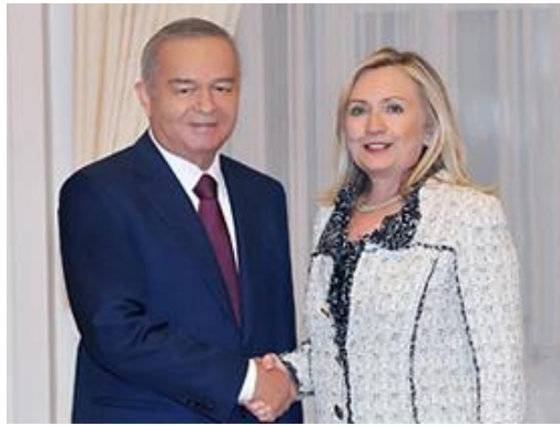
O'zbekiston - AQSH