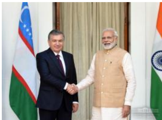
Ўзбекистон – Ҳиндистон