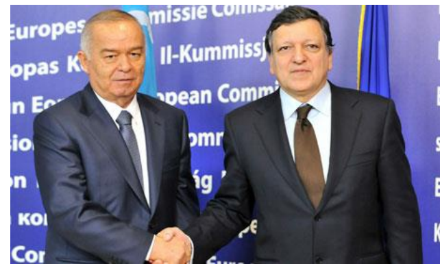
O'zbekiston – Yevropa Ittifoqi davlatlari ( Germaniya, Buyuk Britaniya va Fransiya )