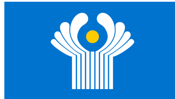
O'zbekiston - MDH