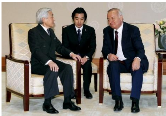
O'zbekiston – Yaponiya