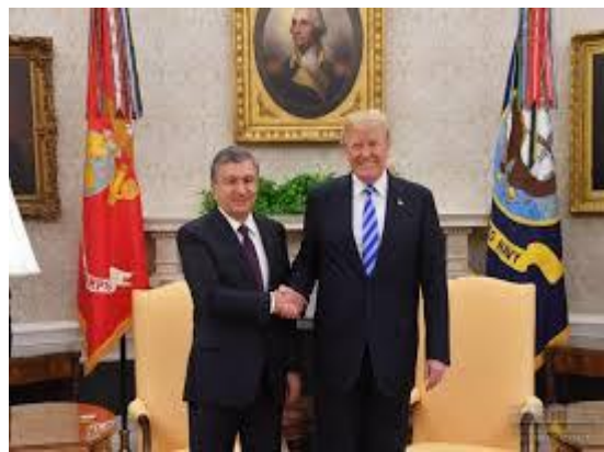
Ўзбекистон - АҚШ