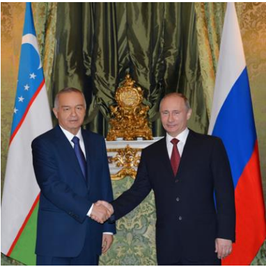
O'zbekiston – Rossiya