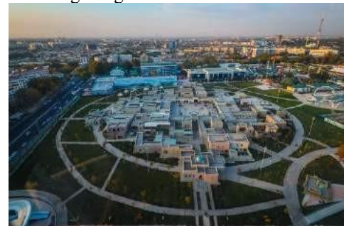
Toshkent shahri. "Navruz" etnopark. Umumiy ko'rinishi

2019 yilda Toshkent shahrining markazida "Navruz" nomidagi etnografik park tashkil etildi. U 2,5 gektardan iborat bo'lib, bu yerda O'zbekistonning barcha hududlaridagi tarixiy binolarning kichiklashtirilgan nusxalari, ya'ni maketi yasalgan. Bu yerda Registon maydoni, Oq-saroy, Xudayorxon o'rdasi, Xiva arki, Kalta minor kabi me'moriy obidalar qurilgan. Har bir viloyatning aholi turar joylarining ham maketi yasali, ko'chalari shakllantirilgan. Tarixiy rekonstruksiyaning bunday turi ham tarixning mohiyatini anglashda, yoshlarning ma'naviyatini rivojlantirishda ahamiyati katta hisoblanadi. O'lkada turizm sohasini rivojlantirishda ham o'z o'rniga ega. Tarixiy rekonstruksiyaning bunday turida tarixchilar me'morlar va quruvchilar bilan hamkorlikda ishlashiga to'g'ri keladi.