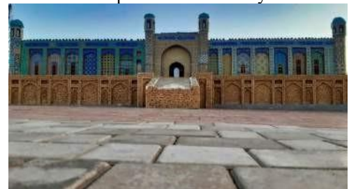
"Navruz" etnopark. Rekonstruksiya.Qo'qon. O'rda.