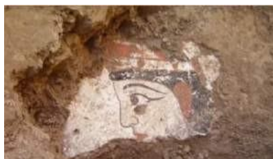
Oqchaxon qal'a. Ibadatxonadan topilgan Xorazmshoh portreti.