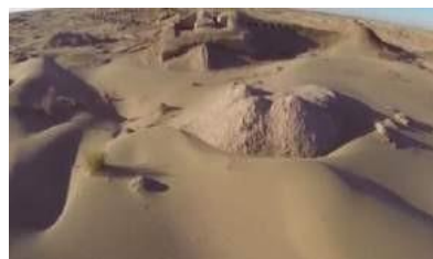
Oqchaxon qal'a. Tadqiqotdan oldingi ko'rinishi.