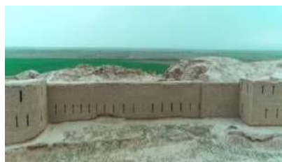
Kampirtepa. Mudofaa devorining rekonstruksiya.