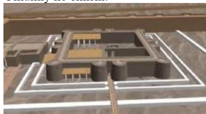
Oqchaxon qal'a. Rekonstruksiya. Ibadatxona.