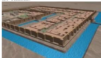
Oqchaxon qal'a. Rekonstruksiya. Umumiy ko'rinishi.