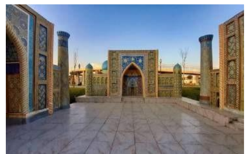
"Navruz" etnopark. Rekonstruksiya. Samarqand.