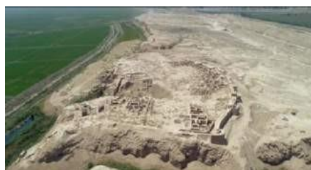
Kampirtepa. Bugungi kunda saqlanish holati.

2019 yilda turizm vazirligi tomonidan Kampirtepa yodgorligining vertual varianti yaratildi. Uning uch o'lchamli ko'rinishida qal'alarning tepadan, yon tomonidan va ichkaridan ko'rinishlari, tevarak atrofi, qal'a ko'rilgan tepalik aniq 3D formatda tasvirlangan. Uning mudofaa devorlari, uy-joylari, ko'chalari, ko'rfaz, mayyoq, jangchilar, qal'aga kelgan kemalar aks ettirilgan.