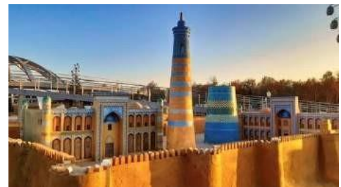
"Navruz" etnopark. Rekonstruksiya.Xiva. Ichon qal'a.