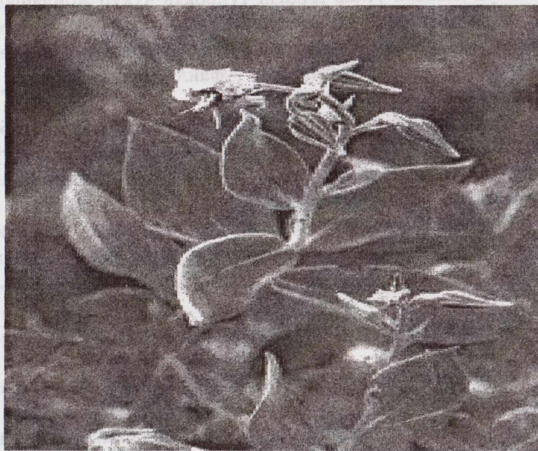
Trichodesma incanum (Bunge) A. DC.

Барги бандсиз, тухумсимон ёки кенг ханжарсимон шаклда, найза учли, пояга жуфт-жуфт бўлиб, қарама қарши жойлашган. Поя ва барглари оқ туклар билан қалин қопланган.