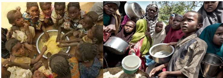
7-rasm. Ocharchilik va suvsizlikdan aziyat chekayotgan aholi (Afrika davlatlari)

Aholi sonining jadal sur'atlar bilan ko'payishi oziq-ovqat yetishmasligi muammolarini keltirib chiqarishi, atrof muhit holatini yomonlashuviga salbiy ta'sir etishi o'zaro aloqada ekanligini ko'pchilik ta'kidlab o'tganligi bejiz emas. P.G.Oldak fikriga ko'ra, «2000-2010 yillarda yer sharida yashaydigan barcha aholini oziq-ovqat bilan ta'minlamoq uchun, donli ekinlar yetishtirishni taxminan ikki marta ko'paytirish lozim».