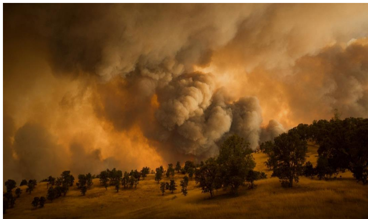
3-rasm. Havo haroratining ko'tarilishi natijasida o'rmon yong'inlarining kelib chiqishi

Ayrim olimlarning ma'lumotlariga ko'ra agar davlatlar o'rtasida atrof-muhitni muhofaza qilish muammosini jiddiy hal qilishni boshlamasalar, 2100 yilga kelib sayyoramizdagi harorat 3,7-4,8^{\circ}\text{C} ga ko'tarilishi mumkin. Klimatologlar ogohlantiradi: harorat oshib borgan taqdirda atrof-muHit uchun qaytarib bo'lmaydigan oqibatlariga olib keladi deb ta'kidlagan (3-rasm).