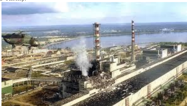
8-rasm. Ukraina AES halokati

Ekologik xavf-xatarning eng kuchli obyektlari AES, kimyo sanoati, neftni qayta ishlaydigan korxonalar, truboprovodlar transport hisoblanadi. Albatta, bulardan tashqari bizga sezilmaydigan texnologik chiqindilar havo, suv, tuproq, o'simlik va boshqa organizmlarni sekin-asta zaharlab kelmoqda, bo'lar ma'lum vaqtdan so'ng to'satdan katta hududga kuchli ta'sir qilishi ham mumkin (8-rasm).