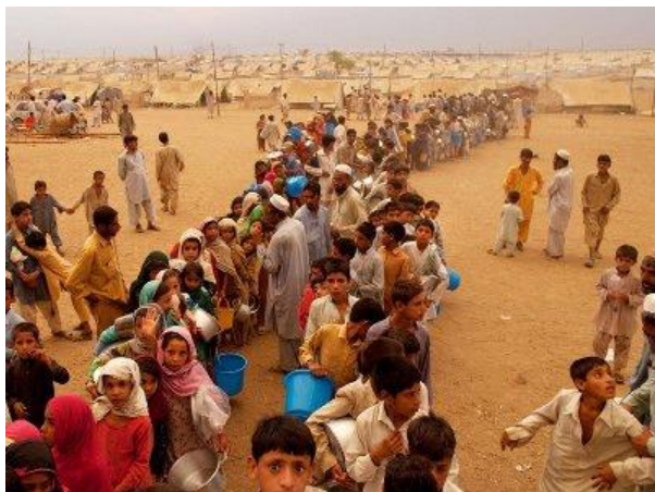
5-rasm. Iqlim migrantlari

XIX asrdan boshlab katta temp bilan dengiz sathining ko'tarilishi sodir bo'ldi. XX asrga kelib okean sathi 17 sm, 2016 yildan boshlab uning yuqori plankasi 3,4 mm har yili ko'tarilmoqda. Okean yaqinidagi mamlakatlarning qishloq xo'jaligi va shahar infrastrukturasini okeanning barqarorligi bilan bog'liq. Harorat, suv va oziq-ovqat krizislari, yong'inlar, suv toshqini, dovul va boshqalar muammoli hududlarda yashaydigan aholini yashash uchun joy izlashiga va iqlim yoki ekologik migrant (muhojir) bo'lishiga majbur etadi.