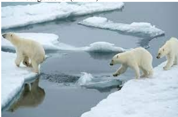
9-rasm. Oq ayiqlarning migratsiyasi

Muzliklar nafaqat qisqarishi, balki muz qalinligi yupqalashuvi sodir bo'lmoqda. So'nggi 30 yil ichida dengiz muzlari qariyb 1,3 m.ga yupqalashdi va qancha muz yupqalashsa muz mavsumi ham qisqa bo'ladi. Hozirgi kunda muzlarning erishi erta bahorda boshlanmoqda. Iqlimning global o'zgarishi qutb sutemizuvchilariga salbiy ta'sir qilmoqda. Ayiqlar va ayiq bolalari uchun kritik davr boshlandi. Urg'ochi ayiqlar o'z bolalari bilan 5-7 oylik ochlikdan chiqishi hayot-mamot masalasi bo'lmoqda. Kanada tadqiqotchilarning fikriga ko'ra, oziq-ovqatning yetishmovchiligi oq ayiqlarning salomatligiga, urg'ochi homilador ayiqlarga va bolalariga salbiy ta'sir ko'rsatdi. Tug'ilish ko'rsatkichi tushib ketdi, yosh ayiqlarning o'rtacha og'irligi taxminan 15%ga tushdi (9-rasm).