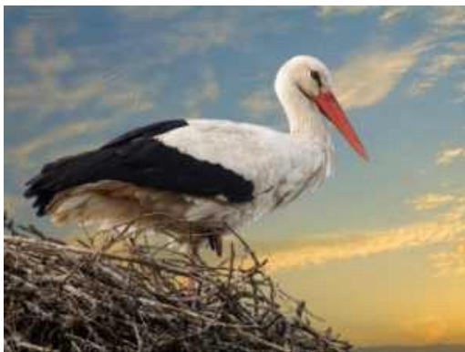
11-rasm. Oq laylak

O'zbekistonda oxirgi 10-15 yil ichida oq laylaklar o'troq qushga aylandilar. Shuning uchun O'zbekistonda bu turni migratsiya davrlari haqida ma'lumotlar olish qiyin, chunki, qaysilari o'troq va qaysilari qishlashdan keyin uchib kelganini bilmaymiz. Qushlarning asosiy qismi avgustning oxiri – sentyabr oyining boshlarida O'rta Osiyodan uchib ketadilar. Sentyabrda Toshkent va Samarqand atrofida, hamda, Qashqadaryo havzasida yashovchi laylaklar uchib ketadilar. Farg'ona vodiysida oxirgi o'n yillikda laylaklarning doimiy qishlashi shakllandi. Bu yerda noyabrdan to fevralgacha botqoq, sholipoyalar va sug'orish kanallar tizimi bo'ylab 20 dan 250 tagacha qushlardan iborat guruhlarini uchratish mumkin. O'rta Osiyoning boshqa hududlarida oq laylakning qishlashi tasodifiy va nomuntazam xarakterga ega. Yevropa laylaklarining bir qismi qishni Ispaniyaning janubida o'tkazadilar, qolganlari esa uzoq sayohatga – markaziy Afrika mamlakatlariga uchib ketadilar. Uchib o'tish davrida ular 12 ming km ni ham yengib o'tishlari mumkin. Laylaklar faqat kunduzi uchadilar va katta masofani bosib o'tish uchun ular parvoz etib uchib yerdan ko'tarilayotgan issiq havodan foydalanadilar (11-rasm).