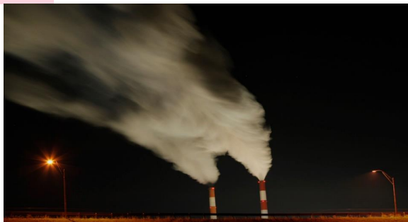
1-rasm. Issiqlik elektr stansiyalarini atrof muhitga zarar keltirishi (Amerika Qo'shma Shtatlari)

barcha sanoat korxonalari hamda issiqlik elektr stansiyalarini (1-rasm) misol qilishimiz mumkin .