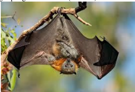
10-rasm. Uchar tulkilar

Tropiklarda yashaydigan Uchadigan tulkilar pishgan mevalarni qidirishi muntazam ravishda ommaviy migratsiya bo'lishiga olib kelmoqda. Masalan, Ugandada yashaydigan Uchadigan tulkilar Afrikaning janubiga ko'chadi, agar Janub yarimsharda yoz kelsa, yomg'ir kelishi bilan qayta shimolga – Nil daryosining qirg'oqlariga uchib keladi (10-rasm).