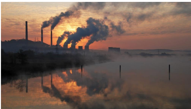
6-rasm. Sanoat korxonalarining atmosferani ifloslashi

Geograflar sayyora miqyosida haroratning 1-2^{\circ}\text{C} ko'tarilishi Yerning tabiat hududlarini qutblarga tomon 150-500 km ga surilishini ta'kidlamogdalar. Demak o'rtacha kengliklarda (dasht mintaqasida) g'allachilik mintaqalarida yog'inlar miqdori kamayadi, aksincha tropik mintaqada yog'inlar miqdori ortadi. Ko'plab aholi zich yashaydigan hududlarda haroratning ko'tarilishi, kishilar salomatligiga sezilarli ta'sir ko'rsatishi mumkin.