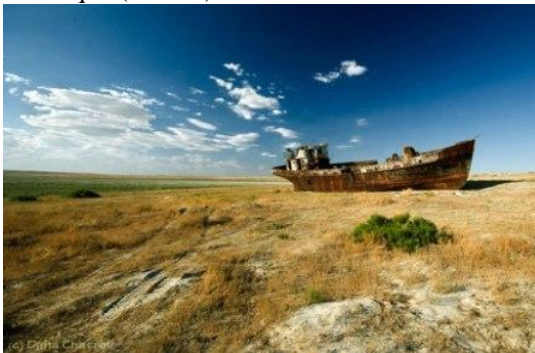
4-rasm. Qurigan Orol dengizi havzasi o'rni

Iqlimning qattiqqo'lligi tufayli hududda yoz behad quruq va qisqa, qish esa uzoq va sovuq bo'lmoqda. Vegetativ mavsum 170 kunga qisqardi. Orol dengizi atrofidagi hududlarda atmosfera yog'ingarchiligi bir necha barobarga qisqardi. Ularning o'rtacha miqdori 150-200 mm ni tashkil etib, mavsumlar bo'yicha ahamiyatli darajada bir tekislikni tashkil etmayapti. Havo namligi 10%ga qisqarib, yuqori darajadagi bug'lanish (yiliga 1700 mm) qayd etilmoqda. Qishda havo darajasi tushib, yozda 2-3°C ga oshdi. Yoz davrida yuqori daraja (+49°C) qayd etilmoqda. Orol dengizi rayonida tez-tez kuchli shamollar esib turmoqda (4-rasm) .