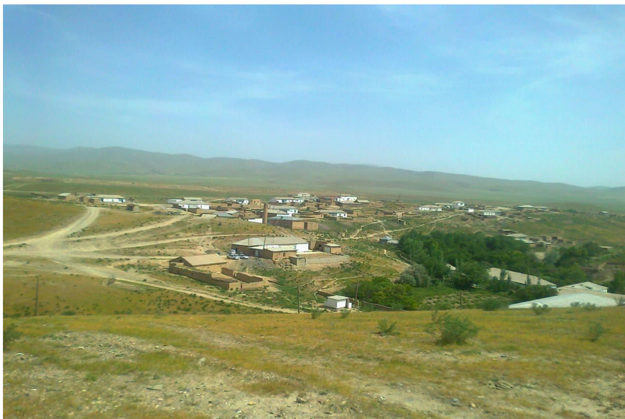
Men tugʻilgan qishloq (Bozorjoy)