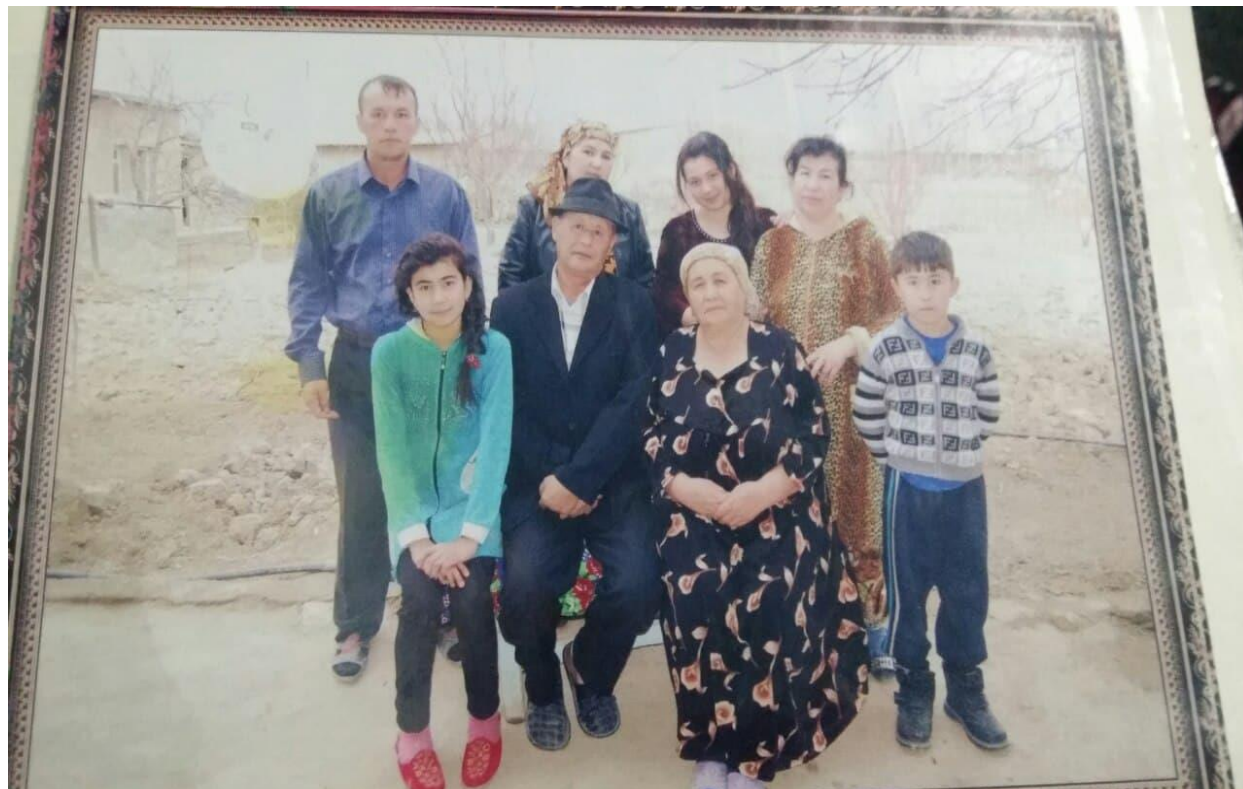
Safar akamni oila a'zolari