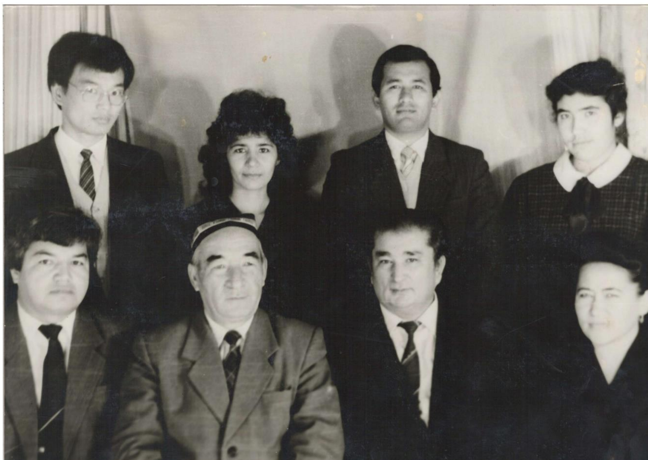
Kafedra a'zolari davrasida