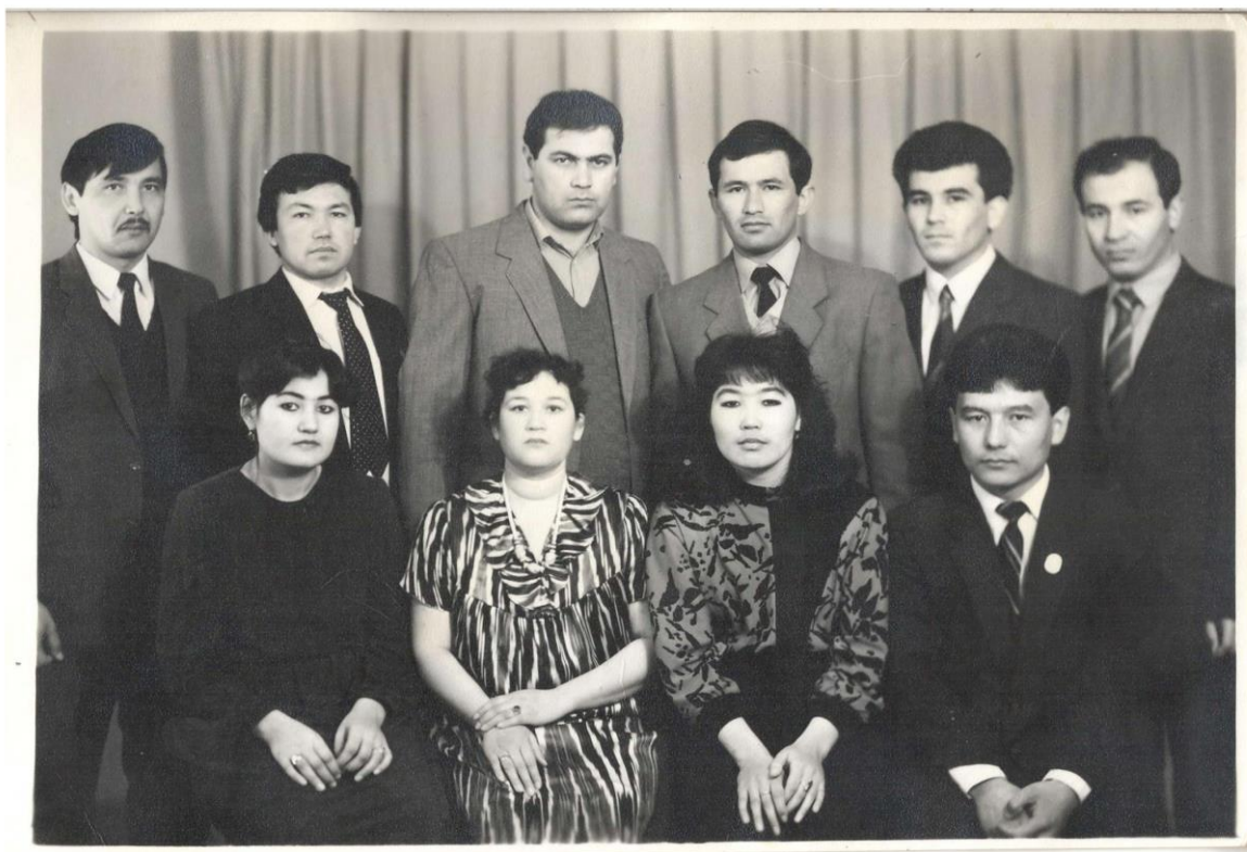
Kursdoshlarim va hamkasblarim davrasida