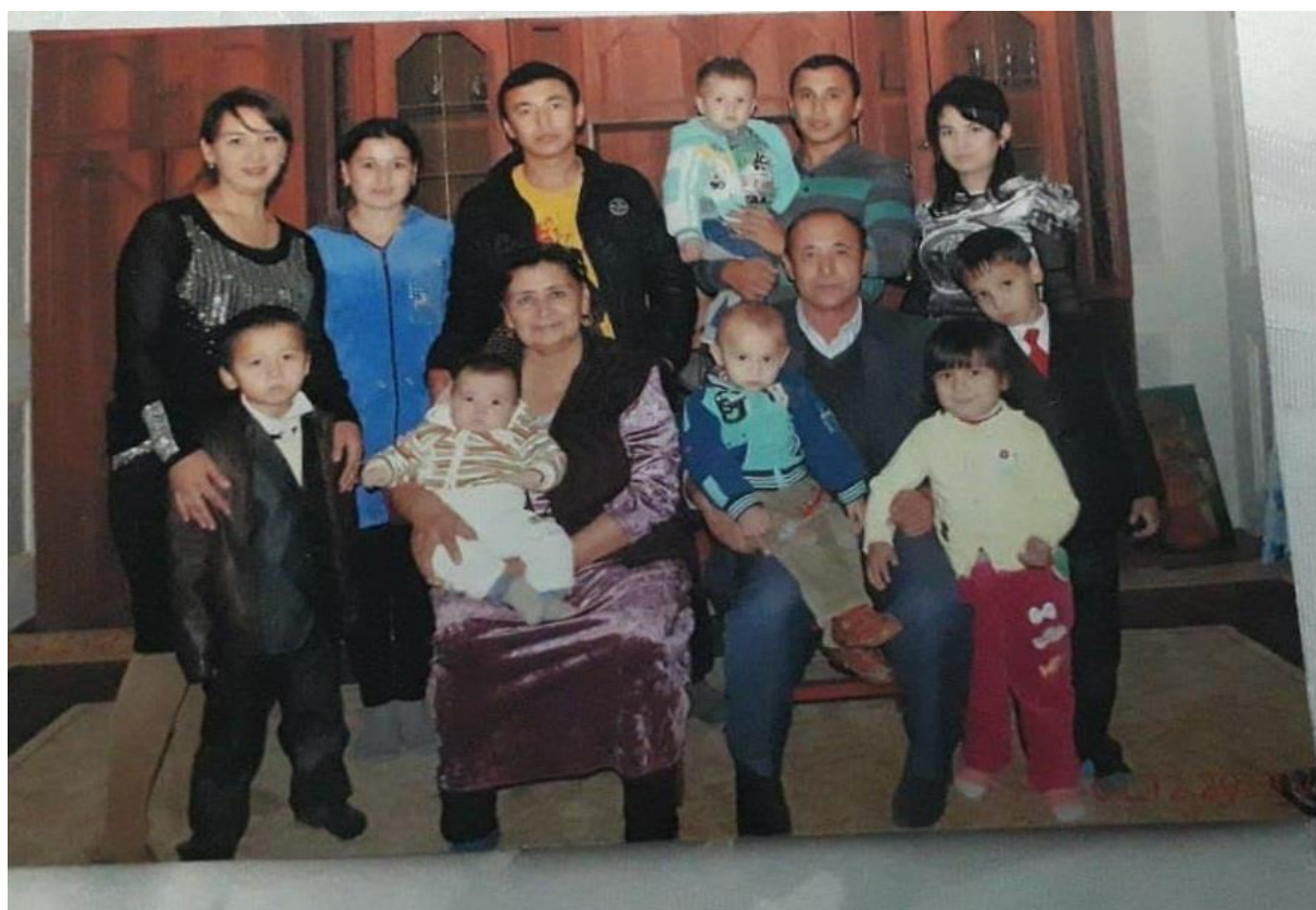
Aka-ukalarim va qarindoshlarim