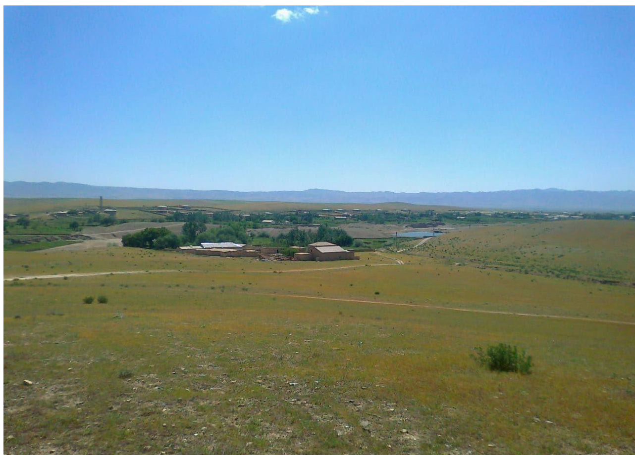
Bolaligim oʻtgan qishloq (Urganji)