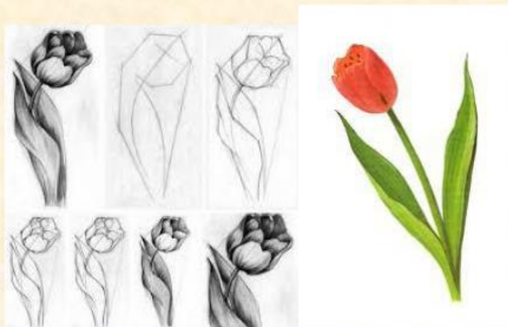
2 - rasm

Bolalar rasm ishlashga kirishar ekanlar rasimlarini xotiralaridagi gul rasimlari bilan solishtirib turushlari aytiladi. Bu ularning o'lchovlari, ranglari, o'lchov nisbatlari, shakli, tuzulishi kabilar haqida bo'ladi. Ishlangan rasim nihoyatda qiziqarli, rang – barang bo'lishi hamda sinfdoshlari ishlagan rasimlarga o'hshamasligi zarurligi tushunriladi.