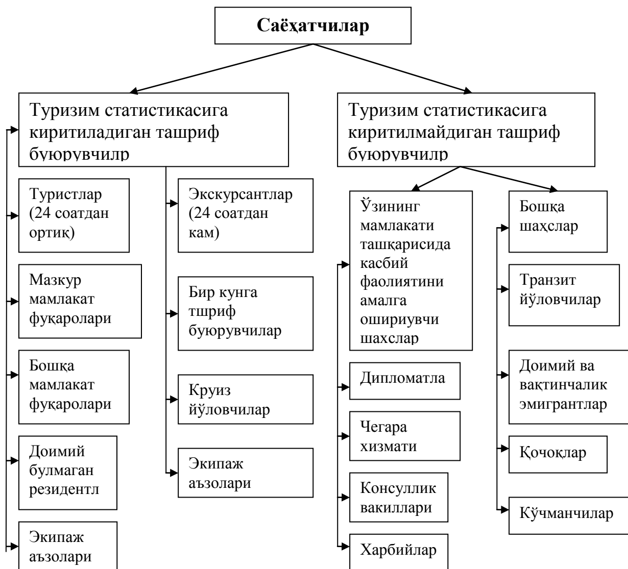
1.1-расм. Саёҳат қилувчи шахсларнинг таснифи.

Халқаро туризмнинг хусусиятли жиҳати шундаки, бу соҳага сарфланган инвестициялар чет эл валютаси сифатида қайтиб келади. Ўзининг иқтисодий моҳиятига кўра чет эл туризми маълум мамлакатга ва қтинча ташриф буюрганлар учун моддий ва маданий бойликлар, товар ва хизматларнинг алоҳида истеъмоли бўлиб ҳисобланади.