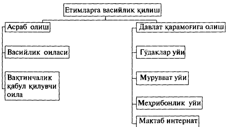
3-расм. Етимларга васийлик қилиш тизими

Бола асраб олувчи ота-оналар болали ёки боласиз бўлиши ҳам мумкин. Шунингдек, тўлиқсиз оилалар, яқка шахслар ҳам бола асраб олиши мумкин. Уларни болани ўз оиласига қабул қилишга ундовчи бир қатор сабаблар мавжуд бўлиб, булар куйидагилардан иборат: