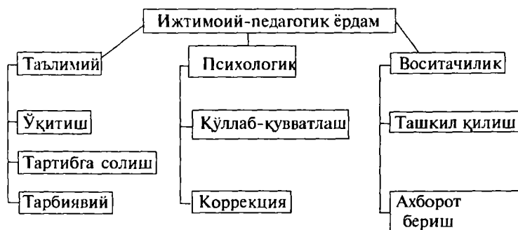
2-расм. Ижтимоий-педагогик ёрдам тизми

Ижтимоий педагогнинг оиладаги асосий фаолиятини ижтимоий педагогик ёрдам ташкил қилиб, бу ёрдам таълимий, психологик ва воситачилик кўринишларида намоён бўлади.