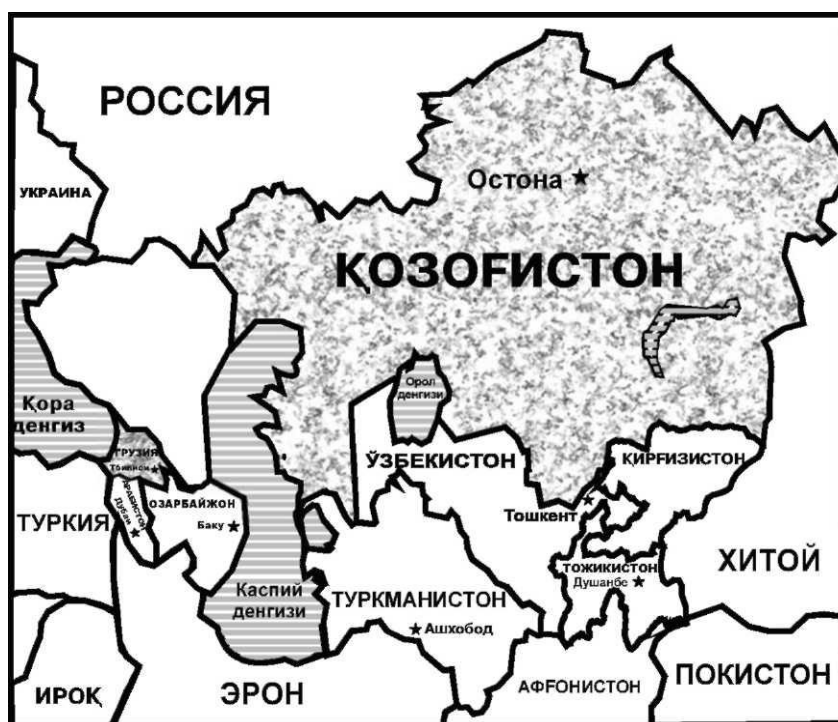
Замонавий Марказий Осиё

Шундан сўнг «Марказий Осиё» тушунчаси узоқ вақт мобайнида, то сўнги давргача геосиёсий тушунча сифатида эмас, балки асосан тарихий ёки географик атама сифатида қўлланилиб келинди. Боз устига, минтақанинг чегаралари ҳам, унинг таркиби ҳам аниқ эмас эди. Ҳатто унинг номи ҳам турли тарихий даврларда ва халқларда ҳар хил аталган. Тарихан олганда, географик омиллар асосий мезон бўлиб хизмат қилган. Юнонлар ва римликлар уни «Трансаксония» - Охус дарёси (Амударё) ортидаги ер деб, хитойлар «Ғарбий ўлка» деб, араблар - «Мовароуннаҳр» ёки икки дарё оралиғи деб атаганлар. Эрон «Турон»дан ажратилган. Баъзан минтақа этнолингвистик асосда «Туркистон» деб аталган. Баъзан эса, у «Ички Осиё» ( Inner Asia ) деб кенгайтирилган тарзда талқин қилинган ва унга Мўғулистон, Ғарбий Хитой, Шимолий Ҳиндистон, Покистон ва Россия Сибирининг жанубий қисми киритилган. Ҳар қалай, ЮНЕСКО томонидан нашр этилган «Марказий Осиё цивилизациялари тарихи» китобида минтақа худди шундай кўринишга эга 1 . Баъзан аксинча, собиқ СССРда бўлганидек, минтақа доираси атиги тўрт республика - Қирғизистон, Тожикистон, Туркменистон ва Ўзбекистонни ўз ичига олган «Ўрта Осиё» тушунчасига қадар торайтирилди.