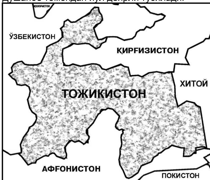
Тожикистон ва унга чегарадош давлатлар

Тожикистон тизма тоғлар билан қопланган мамлакат бўлиб, ҳудудининг ярми денгиз сатҳидан 3,000 метрдан ортиқ баландликда жойлашган. Шундай қилиб, Тожикистон иқтисодий ривожланишга салбий таъсир кўрсатувчи икки географик омил - ҳудуднинг тоғлилиги ва анклавлиги, яъни денгиз портларидан ажралганликни ўзида мужассамлаштирган. Қўшни мамлакатлар билан транспорт коммуникациялари ташқи бозорлар билан фаол алоқа қилиш учун етарли даражада ривожланмаган. Боз устига, ҳатто мамлакатдаги айрим минтақалар билан барқарор алоқа қилиш имконияти ҳам мавжуд эмас. Масалан, қиш ойларида Тожикистоннинг катта қисмини ташкил этувчи Бадахшонга Душанбе томондан йўл деярли тўсилади.