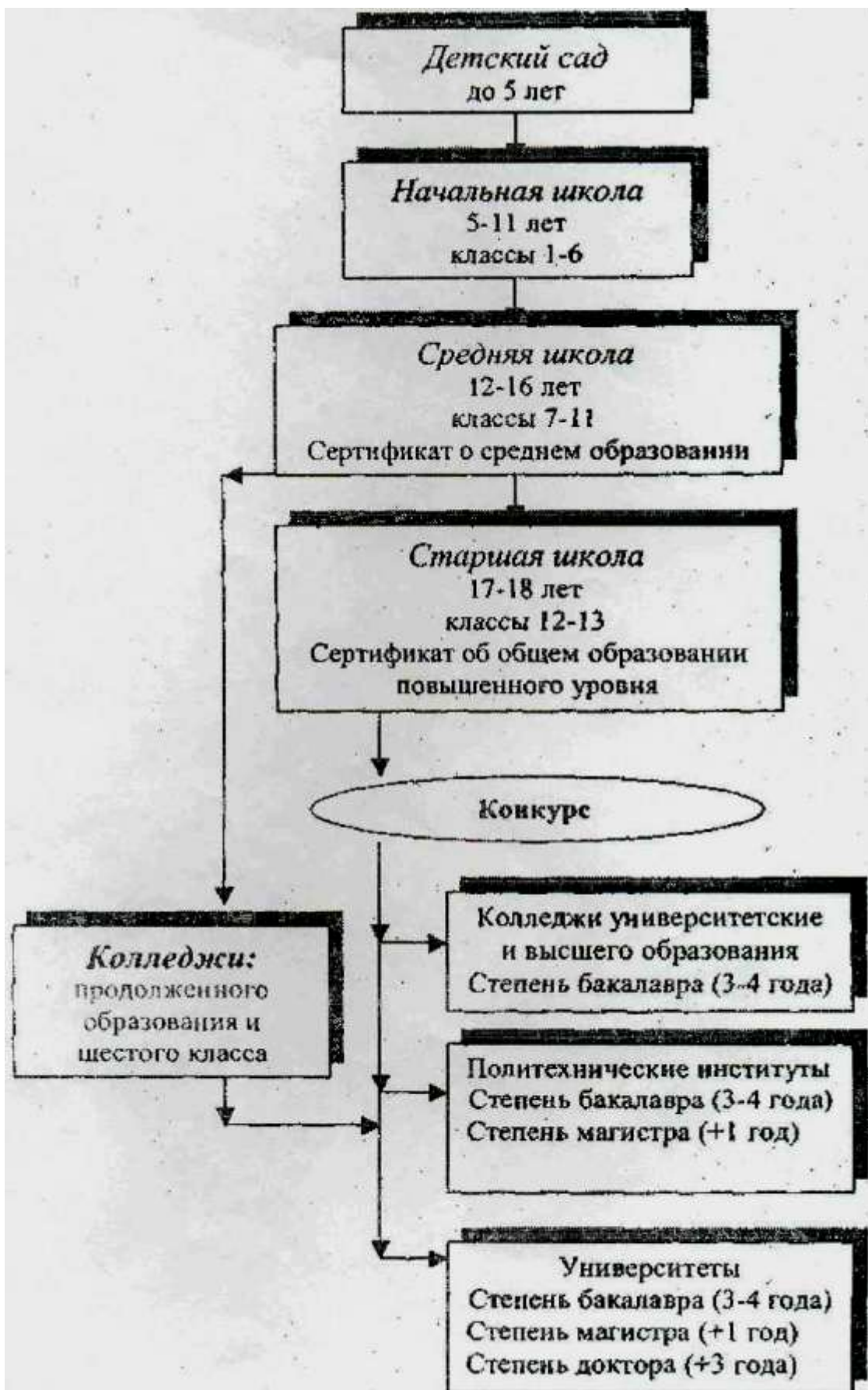
Рис. 2. Схема системы образования Великобритании