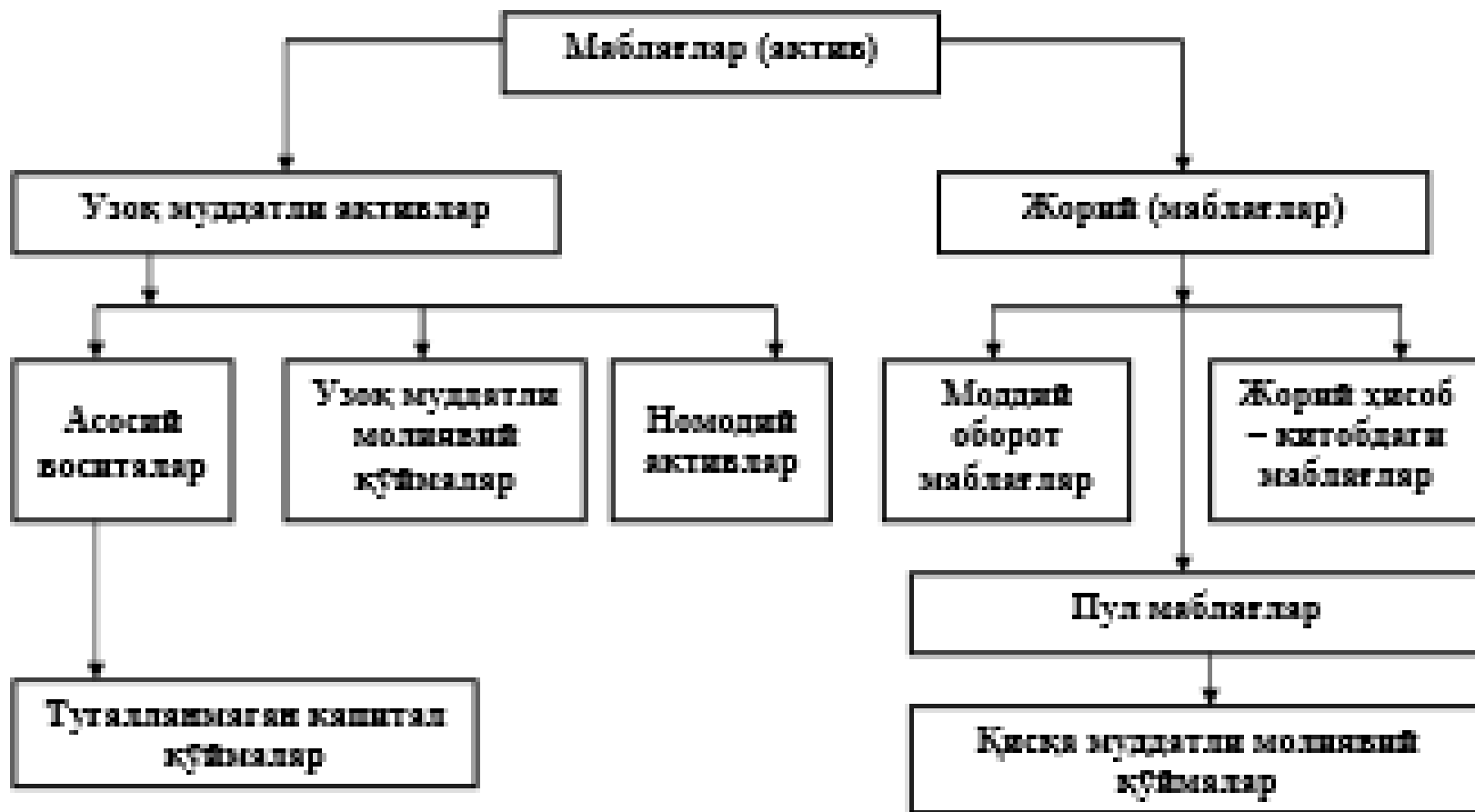
3-чызма. Ма́бле́тле́р та́ркиби.