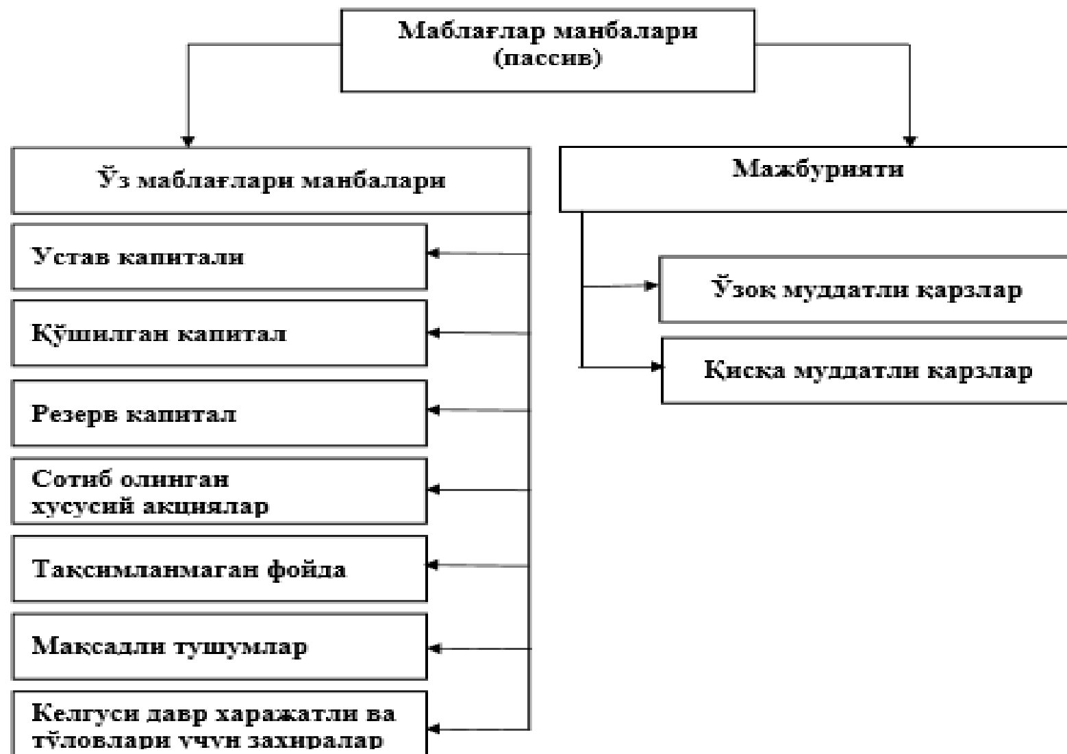
4-чизма. Маблағлар манбалари таркиби.