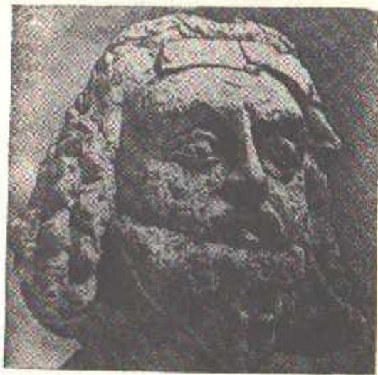
8-расм. Холчаёндан топилган парфиялик аслада ҳайкали (милоддан аввалги I аср — милоднинг I асри).

Монголоид қиёфасининг янги гуруҳлари милоддан олдинги I-минг йилликнинг ўрталаридан Урта Осиёга келиб кела бошлади. Улар аввал Қадимги Бухоро воҳасининг Ғарбий дашт сарҳадида жойлашган,