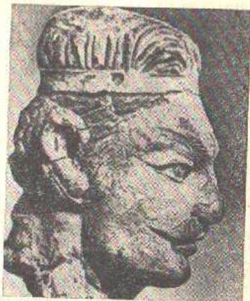
9-расм. Герай аилонга мансуб кушон шахзадаси (Холчаён, милoddan аввалдан I аср — милoddan I аср).

Тасвирларнинг фарқланувчи хусусиятлари бош шаклининг чўзиқлигидирки, эҳтимол бу сунъий шакл ўзгариши натижасидир. Пешона устида сочни сиқиб турувчи безакли тасма бошнинг чўзиқлигини янада кучайтиради. Сочлар текис, тўғри, орқага таралган. Кенг яси пешона тўғри, юнқа бурунга тутшиб кетган, лаблар қалин, иққол ифода этилган, қуюқ мўйлаблар ўткир уч ҳосил қилганча юқорига қайрилган, янги бўртиб турибди, пастки жағлари бесўнақай, буларнинг бари қиёфага кучлилик ва жасурлик мазмунини касб этган. Шунингдек қошлари юқорига қайрилган, кўзлари катта-катта,