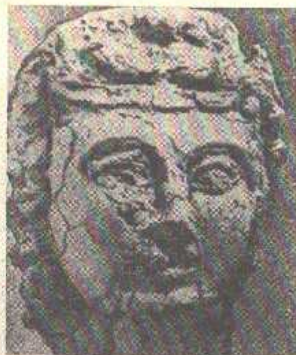
7-расм. Хончаёнда топилган, тахта ўтирган аёл калласи ҳайкали (милоддан аввалги I аср — милоднинг I асри).

Шуни айтиш керакки, баъзи тасвирларда маҳаллий европеонд аҳолига хос бўлмаган ўзига хос морфологик хусусиятлар мавжудлиги аниқланди. Бу, биринчи навбатда, кўз қисмига, бурун тузилиши ва ёноқ бўртмаларига тааллуқлидир. Дарҳақиқат, ҳайкал тасвирида мўъжазгина кўз ўйиқлари, бодомқовоқлик, кўзининг ташқи бурчаги ички бурчагилан юқорироқ эканлиги, буруннинг бир қолигга мансублиги, ёноқларнинг нисбатан бўртмаллиги ифодааланган. Айнан ана шу муҳим белгилар тасвиридаги одам агар монголоид irqига мансуб