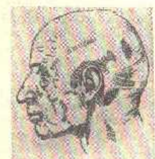
1,2,3-расмлар. Бронза даври Сополлитепа мазлиги эркаклари (миллоддан аввалги II минг йиллик, калла суяги бўйича тиклаган).