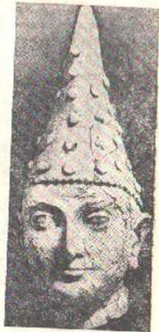
11-расм. Далавзинтепадан топилган учи чўққи бош кийимли шаҳзода боши (милонинг I асри).

Шу муносабат билан Урта Осиё ва қўшни Ҳиндистоннинг ўзарo доимий маданий ва этник алоқаларига эътиборни қаратиш жоиздир. Урта Осиё бир неча миш йиллар мобайнида турли антропологик туркумлар ва улар билан боғлиқ бўлган лингвистик ва этномаданий вилоятларнинг алоқа маскани бўлиб келган. Шу бонедан ундаги на ирқининг ва на халқларнинг келиб чиқишини унга қўшни бўлган мамлакатлар, биринчи навбатда,