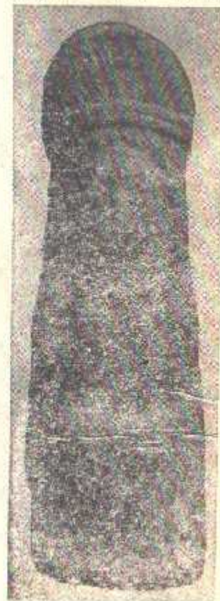
13-расм. Далварзиптепадан топилган маъбуданиннг сопол ҳайкали (милodd-нинг I асри).

Бу фикрнинг тўғри нотўғрилигини текшириб кўриш учун тасвирий санъатнинг бошқа тури — терракотага мурожаат қиламиз.