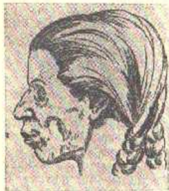
456-расмлар. Бронза даври Сидолитена мазрғали аёллари (калла суяги бўйича тикланган).

кўринади, узун қирғий бурни, аниқ кўзга ташланиб турувчи еллик нағи, кезик лаблари моҳирлик билан тасвирланган. Бошқа бир юнон-бактрия подшоҳи Гелиокл ҳам ана шундай яққол хусусиятларни ўзида мужассамлаштирган. Тиллақош қоплаб турган қалин ослама сочлар, йирик этдор бурун ва чуқур кўзлар. Хулоса сифатида шунини айтиш мумкинки, юнон-бактрия подшоҳларининг