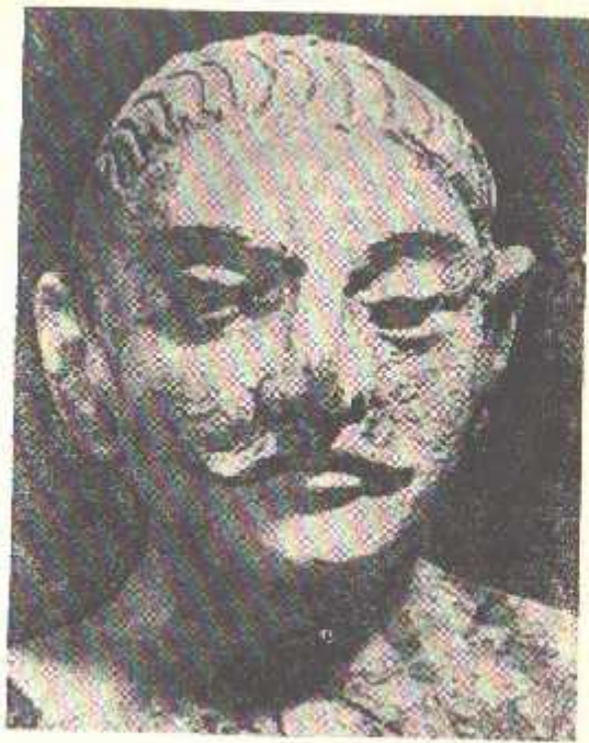
10-расм. Далавзинтепадан топилган мансубдор (милонинг I асри).

ларин усталар бир қолипдан чиқариб тайёрлашган, бинобарин, бу билан ҳайкал тасвирларини яратиш осонлашган, шу нуқтан назардан тасвирдаги кўпгина унсурлар бир-бирига ўхшаб кетади. Далавзинтепада очилган ҳайкаллар гил асосида гишдан тайёрланган. Булар ичида тепаси чўққисимон бош кийимидати шаҳзода деб аталмиш бош айниқса диққатга сазовордир. Услуб жиҳатидан дунёвий ифодага эълолигига қарамай, уста образни бирмунча бўрттириб кўрсатишга ҳаракат қилган. Айниқса у девата (маловк) бош билан қиёсланганда