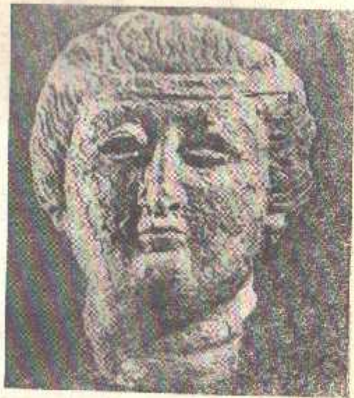
12-расм. Далварзиптепадан топилган худо ҳайкали боши (милodd-нинг I асри).

Далварзиптепадаги ҳайкал тасвирларини кузатишда давом этамиз. Маҳаллий аслодалар нақилларкин ифода этувчи дунёвий тарздаги ҳайкаллардан бири тиззасига тушадиган узун қўйлакли тик турган эркак киши ҳайкаlidir. Унинг белига қайиш боғланган, чан қўли тирсақдан бухилган бўлиб, бирон нима тортиқ қилаётган ҳолатда тасвирланган. Тор, оёқларига тиралиб турган лозим қия бурмалар тарзида аке этирилган. Юзи терапиясимон, боши думалоқ бўлиб, орқа томонга бир оз ялпайган. Калта сочлар чуқур тўлқинсимон излар