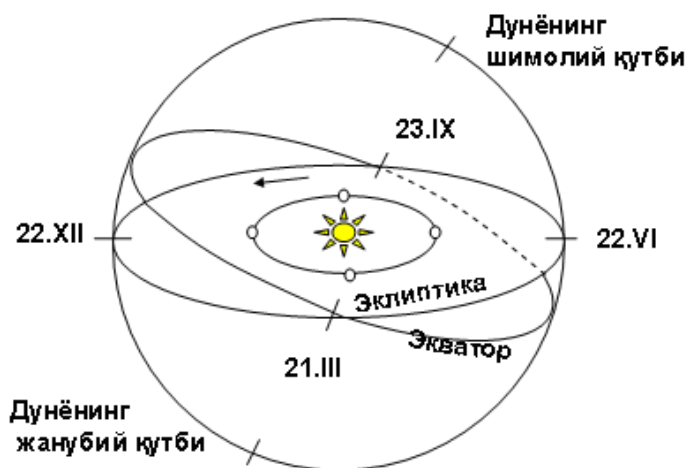
Қуёшнинг эклиптика бўйлаб ҳаракати

Ҳақиқий қуёш вақтини яхшироқ тушуниш учун астрономлар аввал Қуёшнинг кўринадиган йиллик ҳаракати билан танишишни маслаҳат берадилар. Қуёшнинг юлдузлараро ҳаракат йўли астрономияда ЭКЛИПТИКА дейилади. Қуёшнинг бу ҳаракат йўли осмонда катта бир доирани ташкил этади. Астрономик телескоплар ёрдамида олиб борилган кузатишлар натижасида олимлар шундай хулоса чиқаришган: Қуёш йил давомида осмонда гўё бутун дунё бўйлаб саёҳат қилади. У ўз саёҳати давомида доим бир томонга ҳаракат қилиб, роса бир йилдан кейин яна худди ўша жойга- ўша юлдуз ёнига қайтади. Бу – Қуёшнинг йиллик ҳаракатидир .