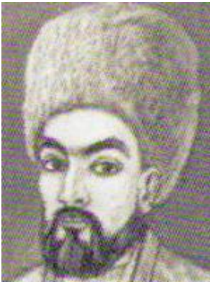
Ogahiy (taxallusi; to'liq ism-sharifi Muhammad Rizo Erniyozbek o'g'li)

(1809.17.12, Xiva yaqinidagi Qiyot qishlog'i — 1874.14.12) — shoir, tarixchi, tarjimon. Mirob oilasida tug'ilgan. Xiva madrasalarida tahsil ko'rgan. Arab, fors, turk tillarini puxta egallagan. Xorazmning mashhur shoir va olimlari, adabiyot muxlislarining suhbatlarida ishtirok etgan. Sharq klassiklari asarlari, ayniqsa, Navoiy ijodini qunt bilan o'rgangan. 1829 yilda amakisi va ustoz Munis vafot etgach, Xiva xoni Olloqulixon (1825—42) Ogahiyning o'rniga mirob etib tayinlagan. Shu davrdan e'tiboran Ogahiy xalq hayoti va saroy ishlari bilan shug'ullangan. Qizg'in ijtimoiy-siyosiy mehnat bilan mashg'ul bir paytda otdan yiqilib, oyog'i «shakarlang» (shol) bo'lib qolgan (1845). 1857 yildan miroblik vazifasidan iste'fo bergan. Umrining oxirigacha moddiy muhtoj, g'amgin, kasalmam ahvolda kun kechirgan.