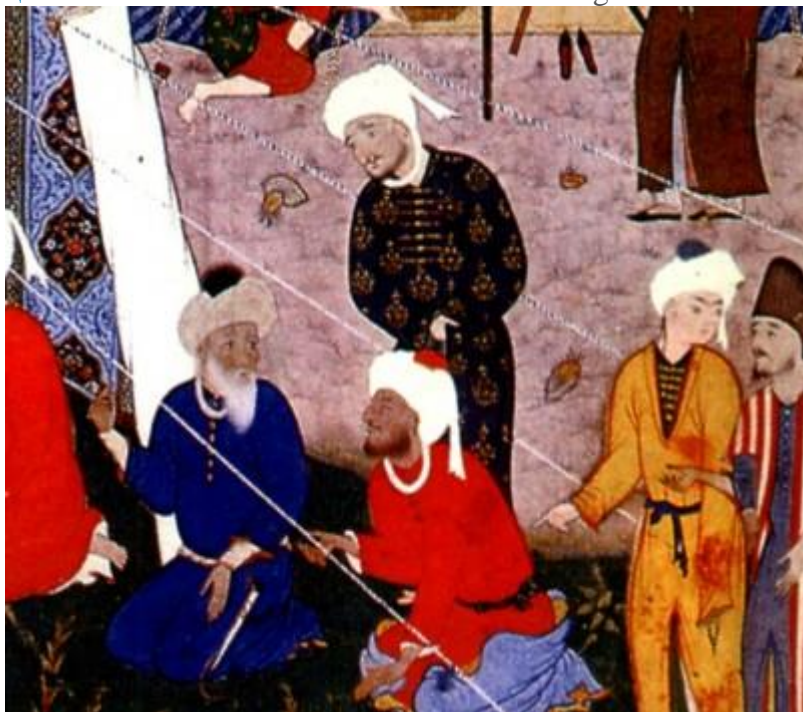
Қарийб бир ярим асрдирки, Мунис

Шарқ юлдузи March 4, 2015 Нурбой Абдулҳаким. “Фирдавсу-л-икбол”нинг адабий-эстетик қиймати 2015-02-24T07:48:54+00:00 Uncategorized